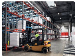
Zone de stockage