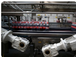
Pack avant la palettisation