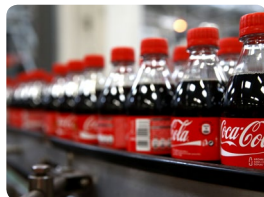
Bouteilles après étiquetage