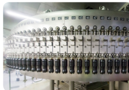
Souffrage : injection du produit fini dans les bouteilles