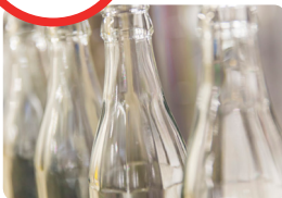
Ligne verre 33cl